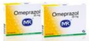
OMEPRAZOL MK 20 MG CAJA X 14 TAB.