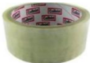
CINTA COLBON 40 M X 30 METROS X 6 UDS CAJA X 72 DISPLAYS X 6 UDS