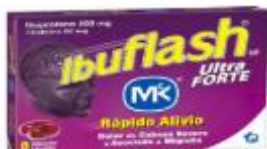
IBUFLASH ULTRA FORTE CAJA X 8 CAPSULAS. CAJA X 12 UDS