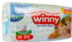
PAÑAL WINNY SEC ETAPA 3 X 30+ 20 TOALLITAS ALOE VERA ----PACA X 8 UD