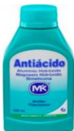
ANTIACIDO MK X 150 ML - CAJA X 12 UDS