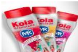
KOLA DOY PACK X 135 GR CAJA X 12 UDS