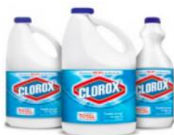
CLOROX REGULAR X 1.000 ML.- CAJA X 12 UDS CLOROX REGULAR X 1.800 ML. CAJA X 6 UDS CLOROX REGULAR X 3.800 ML CAJA X 4 UDS