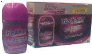
YODORA MINI ROLLON POWDER X 30 GR. DISP X 3 UDS. CAJA X 24 DISP.