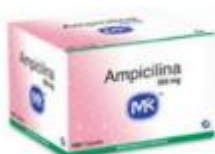
AMPICILINA MK 500 MG CAJA X 100 TAB.