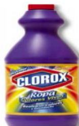
CLOROX ROPA COLOR X 450 ML.- CAJA X 24 UDS