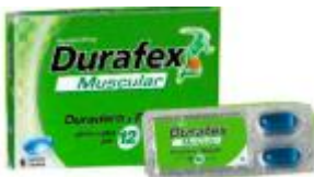
DURAFEX MUSCULAR CAJA X 6 CAPSULAS. CAJA X 12 UDS