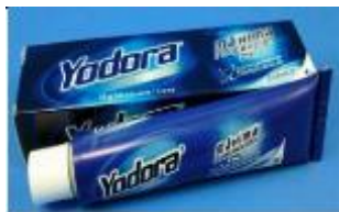
YODORA TUBO X 12 GR. CAJA X 288