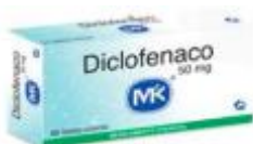
DICLOFENACO MK 50 MG CAJA X 20 TABL.