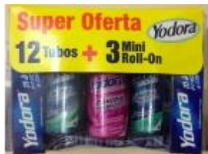
OFERTA YODORA 12 TUBOS X 12 GR + 3 MINI