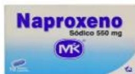
NAPROXENO 550 MG CAJA X 10 TAB