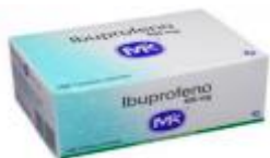
IBUPROFENO MK 400 MG CAJA X 100 TAB. PACA X 32 UDS