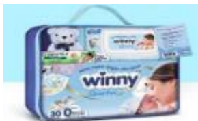
KIT RECIENTE NACIDO WINNY ETAPA 0. -CAJA X 6 UDS.