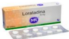
LORATADINA MK 10 MG CAJA X 10 TAB.