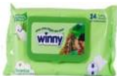
TOALLITAS ALOE VERA X 24 TOA --CAJA X 24