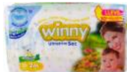
PAÑAL WINNY SEC ETAPA 2 X 30+ 20 TOALLITAS ALOE VERA ----PACA X 8 UD