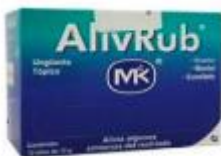
ALIV RUB UNGÜENTO LATA X 12 GR-DISPLAY X 12 UDS. CAJA X 30 DISPLAYS