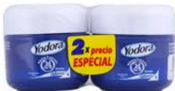
YODORA CREMA POTE X 32 GR 2 X PRECIO ESP. CAJA X 36 UDS