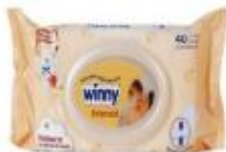
TOALLITAS AVENA Y MIEL X 40 TOA –CAJA X 24