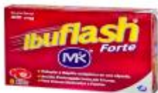
IBUFLASH FORTE CAJA X 8 CAPSULAS. CAJA X 12 UDS