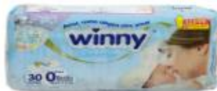
PAÑAL WINNY SENSITIVE GOLD ETA 0 X 30+20 TOALLITAS RN --PACA X 12 UD