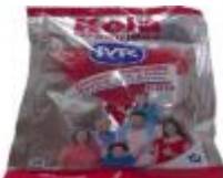
KOLA MK SOBRE X 30 GR DISPLAY X 6 UDS CAJA X 12 DISPLAYS