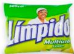
LIMPIDO RPTO X 500 ML BOLSA X 6.- CAJA X 24