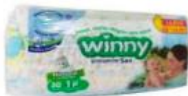
PAÑAL WINNY SEC ETAPA 1 X 30+ 20 TOALLITAS ALOE VERA ----PACA X 8 UD