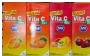
VITA C MK + ZINC X 100 TAB. CAJA X 24 DISPLAY.