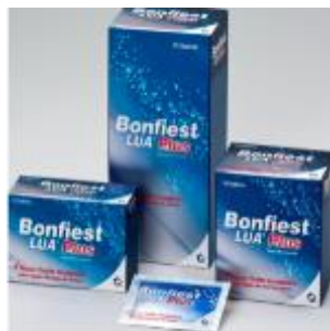
BONFIEST LUA PLUS