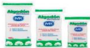
ALGODÓN MK X 25 GR DISPLAY X 12 UDS