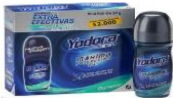
YODORA MINI ROLLON DYNAMIC X 30 GR. DISP X 3 UDS. CAJA X 24 DISP.