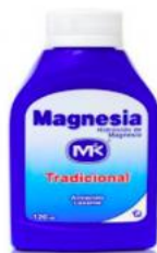
LECHE MAGNESIA MK X 120 ML -CAJA X 36 UDS