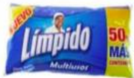
LIMPIDO COJIN X 150 ML BOLSA X 6.- CAJA X 14