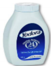
YODORA TALCO X 60 GR. CAJA X 72 UDS.