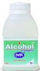
ALCOHOL MK X 120 ML -CAJA X 20