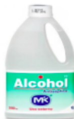
ALCOHOL MK X 350 ML -CAJA X 12