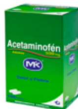
ACETAMINOFEN MK X 100 TAB. CAJA X 9 UDS