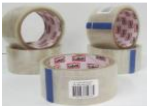
CINTA COLBON 48 MM X 40 MTRS CAJA 72 UDS