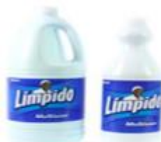
LIMPIDO REGULAR X 1.00 ML – CAJA X 12 UDS LIMPIDO REGULAR X 1.800 ML – CAJA X 6 UDS LIMPIDO REGULAR X 3.800 ML – CAJA X 4 UDS