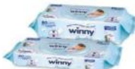
TOALLITAS RECIEN NACIDO X 40 TOA –CAJA X 24