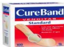
VENDITAS CUREBAN X 100 UDS. CAJA X 100 DISPLAYS