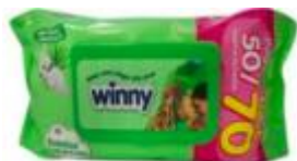
TOALLITAS ALOE VERA X 70 TOA –CAJA X 12