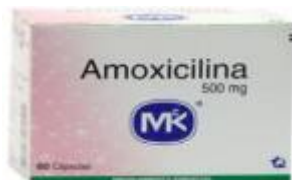
AMOXICILINA MK 500 MG CAJA X 100 TAB.