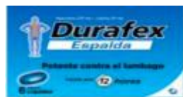
DURAFEX ESPALDA CAJA X 6 CAPSULAS. CAJA X 12 UDS