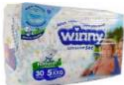
PAÑAL WINNY SEC ETAPA 5 X 30- X 8 UD