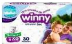
PAÑAL WINNY SEC ETAPA 4 X 30- X 8 UD